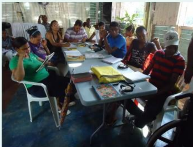
Acompañamiento grupo de Alfabetización de CEPAE, CCPoveda