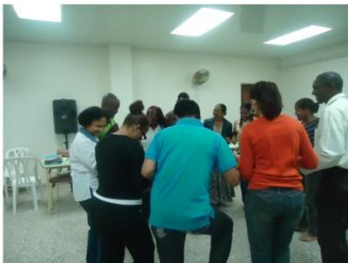
Realizando la danza de los pastores, grupo Diplomado de Alfabetizadores, CCPoveda

¿Qué valores tenemos que potenciar para implementar una comunidad de acogida con equidad de relaciones y derechos para extranjeros y extranjeras?